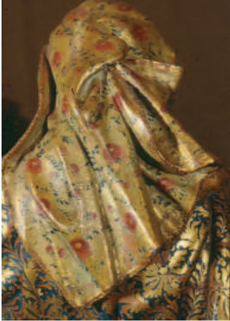
Figura 2 - Detalhe do véu da menina Maria, com arranjo bem original.

GERAÇÕES ME CHAMARÃO BEM AVENTURADA PORQUE O ONIPOTENTE OBRA PARA MIM (Lucas I, 46-50);