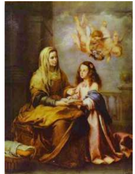
Figuras 3, 4, 5 - Três pinturas: Educação da Virgem , Peter Paul. Rubens (1625/26) Sant'Ana. Forro da capela-mor de Congonhas do Norte , Manoel Antônio da Fonseca. Minas Gerais (1777); Santana e a Virgem , Estéban Bartolomé Murillo (século XVII).