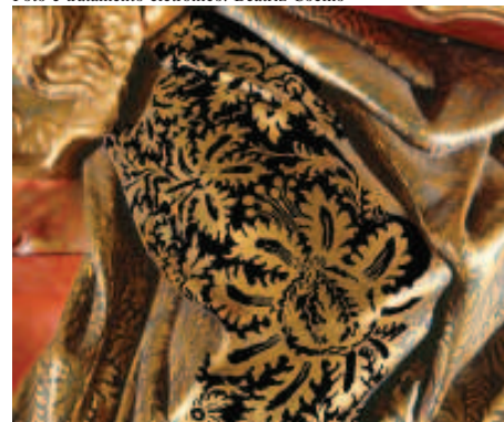
Figura 12 - Parte da túnica de Sant'Ana, com destaque digital para o desenho da policromia (crisântemos).