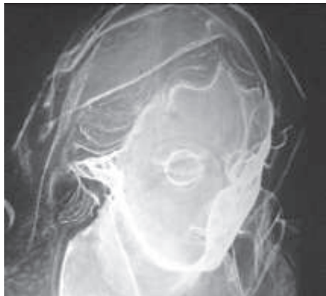
Figura 9 - Radiografia da cabeça de Santana.

Foram usados motivos de ramos de flores na técnica de esgrafito, executada com muita segurança e predominando o azul, (um pouco esverdeado devido ao amarelecimento do verniz), vermelho, laranja e dourado. Segundo análise realizada no Laboratório de Ciência da Conservação (Lacior), do Centro de Conservação de Bens Culturais Móveis (Cecor) da Escola de Belas Artes da Universidade Federal de Minas Gerais, a preparação foi feita com sulfato de cálcio, a carnação é oleosa, o pigmento azul ultramar foi usado no manto e na túnica, e o vermelho do manto é óxido de ferro.