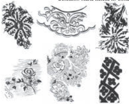
Figura 13 - Desenhos do estofamento da veste de Sant'Ana Mestra feitos com decalques.