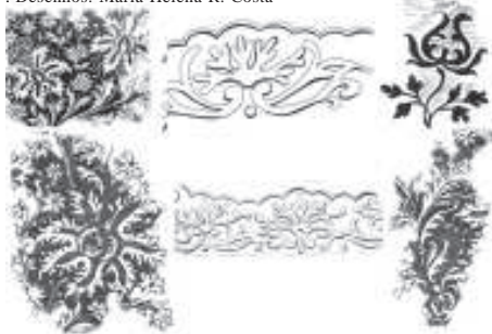
Figura 14 - Desenhos do hábito de São João da Cruz e do hábito de São Simão Stock.