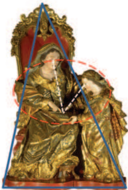
Figura 6 - Principais linhas da composição: Azul: formato geral; vermelho: área de maior interesse; branco: mãos e direção dos olhares.

e formas extremamente delicadas, apontam para o livro, para o qual se dirigem os olhares de ambas as figuras (FIG.7).