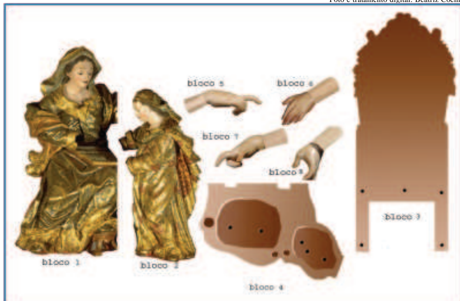
Figura 8 - Foto, trabalhada digitalmente, mostrando os blocos do conjunto escultórico.