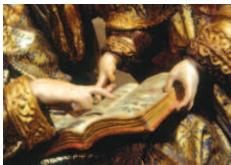
Figura 7 - Mão direita de Sant'Ana e mãos direita e esquerda de Maria.

colocada em um nicho de retábulo ou oratório, e ser observada de frente. Não há indícios nem informação da utilização da obra em andor para procissão.