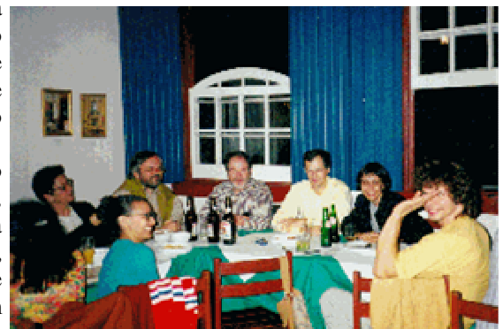
Jantar de confraternização em Ouro Preto