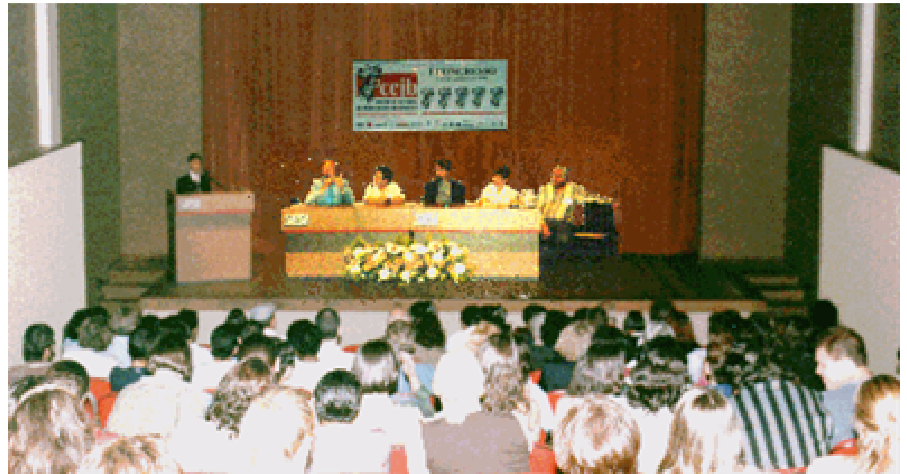
Sessão plenária do Congresso